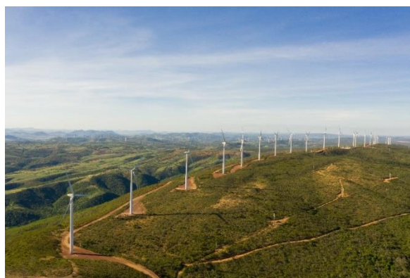
Imagem 2 Complexo Alto Sertão III - Fase A

O Alto Sertão III – Fase A possui 26 parques eólicos, com capacidade instalada de 432,6 MW – 155 Turbinas GE, e entrou em operação comercial em dezembro de 2022. A energia é comercializada nos mercados livre e regulado, 53,3% e 46,7%, respectivamente.