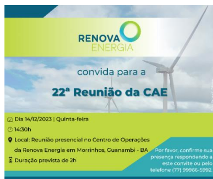
Figura 1 - Convite da 22ª Reunião da CAE

No projeto Alto Sertão III em operação no estado da Bahia, foi realizada a 22ª Reunião Ordinária da Comissão de Acompanhamento do Empreendimento – CAE realizada em 14 de dezembro de 2023. Os membros da Comissão (representantes Governamentais, Não-Governamentais e líderes comunitários), tiveram a oportunidade de trocar informações acerca da fase de operação deste empreendimento, contemplando os aspectos de atendimento às condicionantes, com as atualizações da execução dos programas básicos ambientais.