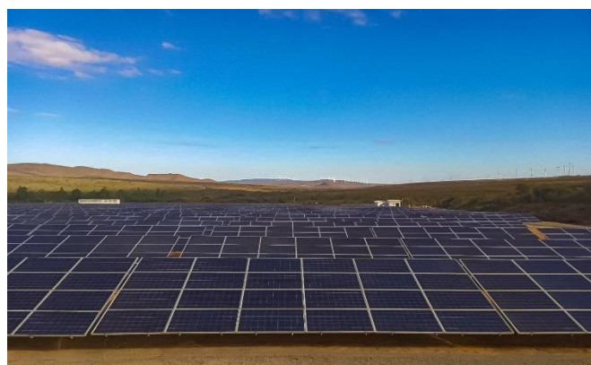
Imagem 3 Complexo Solar Caetité

O Complexo Solar Caetité, localizado no sudoeste da Bahia, tem capacidade instalada de 4,8MWp, composto por 19.200 módulos/placas de 245W cada e 4 inversores.