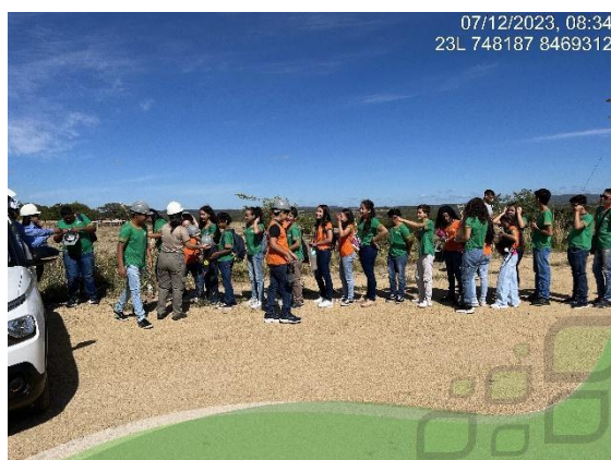
Imagem 1 - Visita técnica de alunos aos parques eólicos do Complexo Alto Sertão III.

A Renova Energia participou da 2ª Feira de Negócios do município de Pindaí/ BA com a exposição de artesanatos e produtos da agricultura familiar. Durante o evento, a equipe social da Companhia realizou ação voltada para a educação ambiental com debates sobre o meio ambiente, palestras educativas e informativas voltadas a agricultura familiar e empreendedorismo, assim como a realização de plantio de sementes.