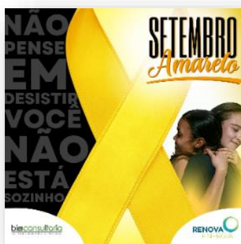
Figura 2 - Peça da palestra da Campanha

Deste modo, a Renova Energia consolida o canal para o diálogo entre os setores envolvidos e afetados, direta ou indiretamente, pelo referido empreendimento, celebrando o fortalecimento da relação com as partes interessadas.